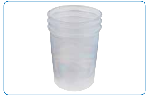
Beker voor de directe afvalafvoer of voor hergebruik.