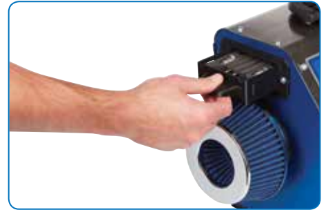
Praktisch spuittipvak voor het opbergen van alternatieven en reservespuittips.