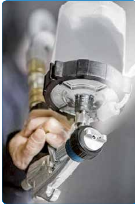
Talrijke instelmogelijkheden evenals de 360°-functie garanderen een optimale handling en uitstekende spuitresultaten.