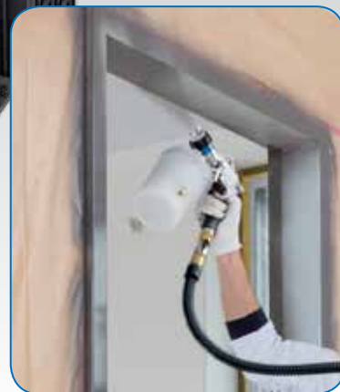
360°-inzet - ook bovenhoofds