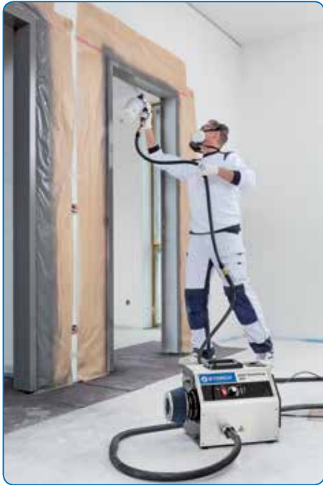
HVLP Smart Finish 360 is geschikt voor coatings bij renovaties en in de nieuwbouw.