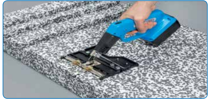
Met optioneel toebehoren (profiel-snijd-slede) kunnen diepte-, profiel-, reliëf-, en verstek snijden eenvoudig, snel en precies worden uitgevoerd