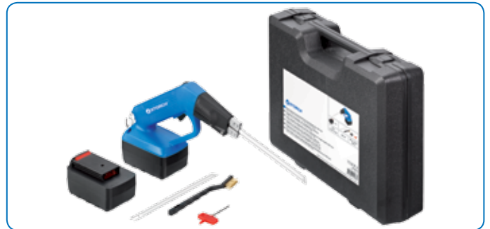
Set in praktische opberg- en transportkoffer