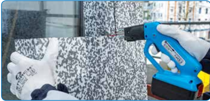
Exact snijden tot een plaatdikte van 250 mm* zonder nabewerken